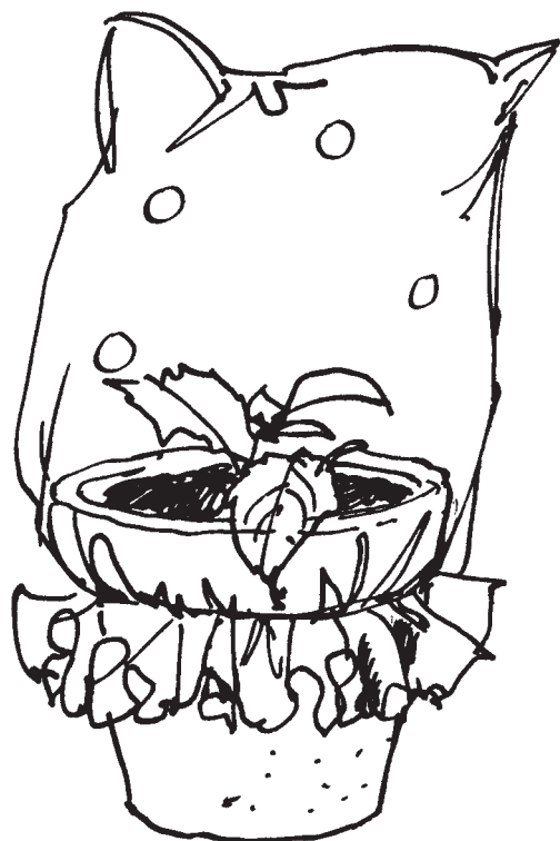
Plastpåse, med några lufthål i påsen, ger drivhusklimat.

ett örtartat skott och ta bort de nedersta bladen. Klipp nedanför ett bladfäste eller mellan två bladfas-ten, där skottet är hårdast och minst mottagligt för röta. Här kommer de nya rötterna.