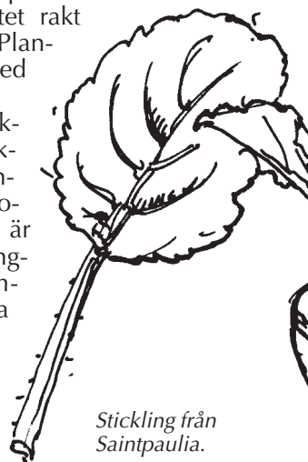
Stickling från Saintpaulia.

Plantor som sticklingförökas blir exakta kopior av den planta man tar ifrån – moderplantan. Viktigt är också att ta sticklingarna från friska kompakta och kraftiga plantor, som inte blommar. Alternativet är att skära bort både blommar och knoppar.